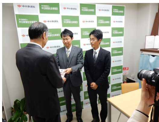
12月15日（金） 中日新聞社内にて

2011年東日本大震災を機に、地域社会との絆の大切さを改めて感じ、本格的にチャリティー活動を始動させました。以後、継続的に「地域貢献」「広域社会福祉」への支援を行っています。今回の歳末たすけあい運動もこのチャリティー基金から寄託させていただきました。